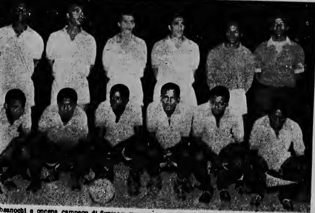
Subcampeonnan di Surinam Transvaal, a sufri su promer derrota den Antillas Hungando un bon partido, e sub-campeonnan di Aruba, Bubali, a logra vence e huespednan cu score 2-1. Foto: e oncena di Transvaal cu tambe a hunga un bon partido, pero sin embargo a perde cu tur honor.